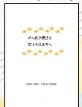
がん化学療法を受けられる方へ

しおりには、当院でがん化学療法を受けていただくまでの流れ・緊急時の連絡方法・日常生活での工夫、脱毛時の頭皮のケアやウィッグの手入れ方法・利用できる制度などが記載されています。日常の自己ケアにお役立てください。